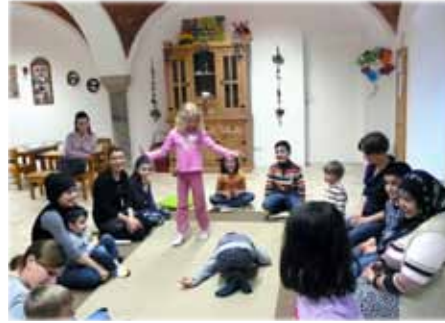
Beim gemeinsamen Spielen kennen lernen.

Familien mit albanischen, türkischen und österreichischen Wurzeln waren bisher dabei und es ging immer fröhlich und lebhaft zu. Da es neben den Kindern schwierig war, Themen zu