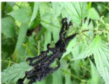
Echt nimmersatt müssen sie sich mehrmals häuten.

Das Schmetterlingsjahr neigt sich dem Ende zu – trotzdem hat heuer das Tagpfauenauge noch einmal eine Generation hervorgebracht, die z. Z. im Raupenstadium in Scharen auf Brennnesseln zu sehen ist.