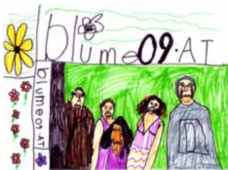
Unser Wahlplakat – von Moritz nachgezeichnet.

Die Wahlwerbung war für uns alle sehr aufregend und letztlich haben wir unser erstes großes Ziel erreicht. Wir – die blume – sind im Oktober 2009 – trotz starker Konkurrenz – mit einem Mandat in den Gemeinderat eingezogen.