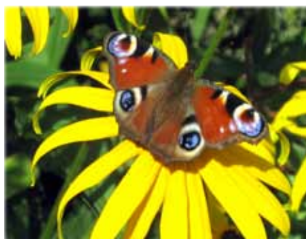
Sehr schöne Zeichnung, aber leider schon viel zu selten.

Spätsommertagen erfreuen können. Danach beginnt für diese Falter die schwierigste Zeit – sie müssen sich einen geeigneten Platz zum Überwintern suchen. Im Frühjahr, wenn die Sonne richtig zu wärmen beginnt, kommen sie wieder aus ihren Verstecken und bringen ab Mai eine neue Generation hervor.