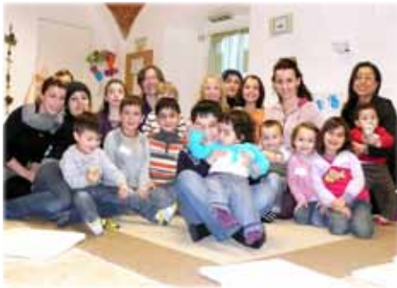
Mütter und Kinder - bunt gemischte Kulturen.

hung und viele weitere Themen. Bislang sprechen alle Teilnehmerinnen gut deutsch, aber wir freuen uns auch besonders über Frauen, die noch nicht so perfekt deutsch können und in diesem geschützten Rahmen ihre Kenntnisse trainieren und verbessern wollen.