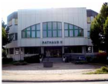
Hier wird diskutiert und entschieden – leider auch oft unnötig gestritten.

Ernüchternd für uns aber war, wie es im Gemeinderat und den Ausschüssen zugeht und wie von Manchen nur destruktive Opposition betrieben wird.